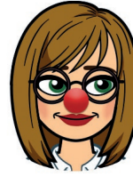
Taina Tyrväinen markkinointi- ja viestintäpäällikkö