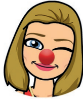
Riina Lipponen toiminnanjohtaja